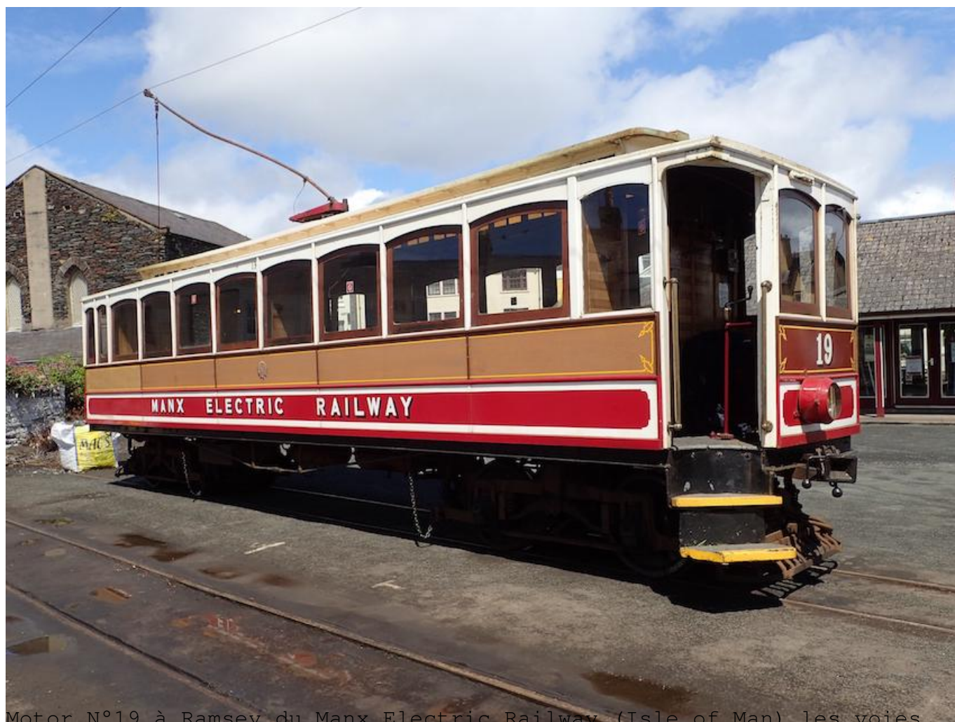
Motor N°19 à Ramsey du Manx Electric Railway (Isle of Man) les voies sont en 3 pieds = 914mm. (2017)