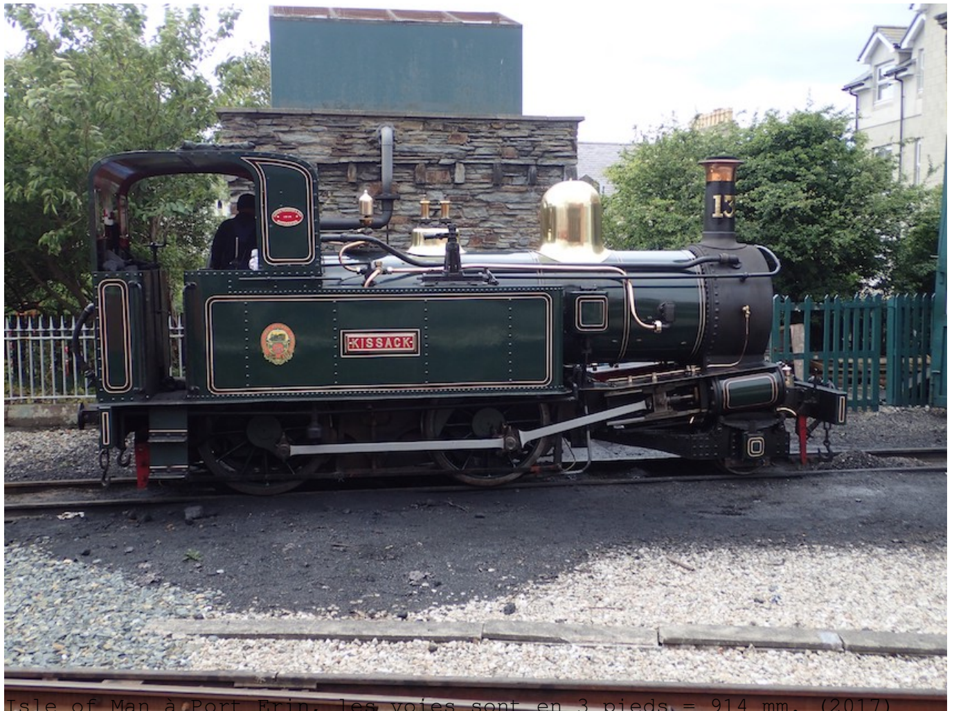
Isle of Man à Port Erin, les voies sont en 3 pieds. = 914 mm. (2017)