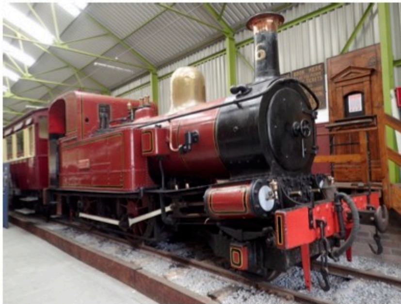
N° 6 Peveril au musée de Port Erin