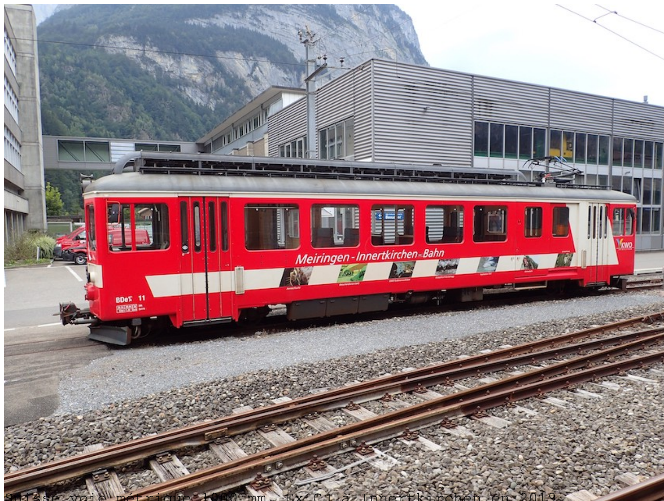
Suisse voie métrique 1000 mm. Ex CJ à Innertkirchen en 2019.