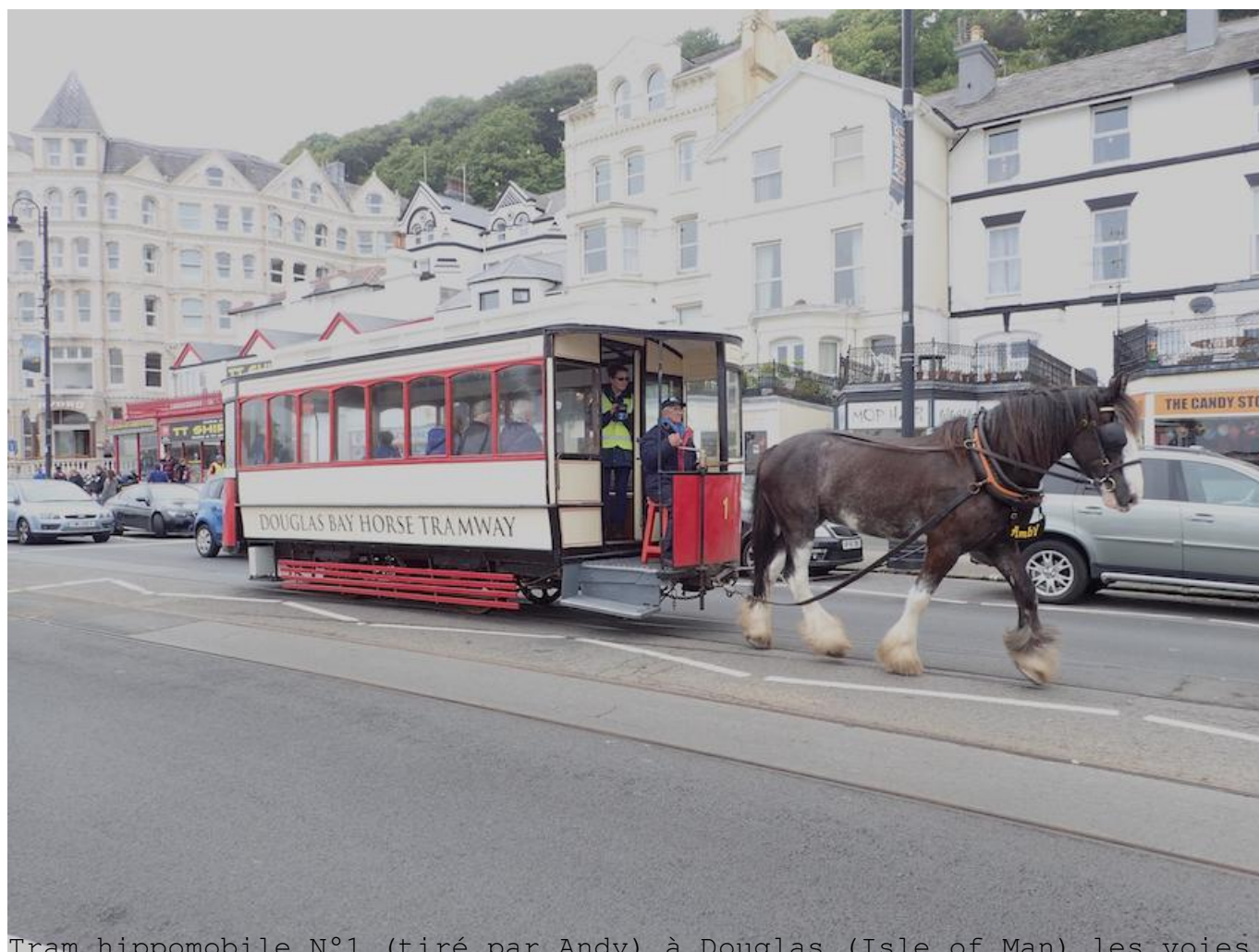
Tram hippomobile N°1 (tiré par Andy) à Douglas (Isle of Man) les voies sont en 3 pieds = 914mm. (2017)