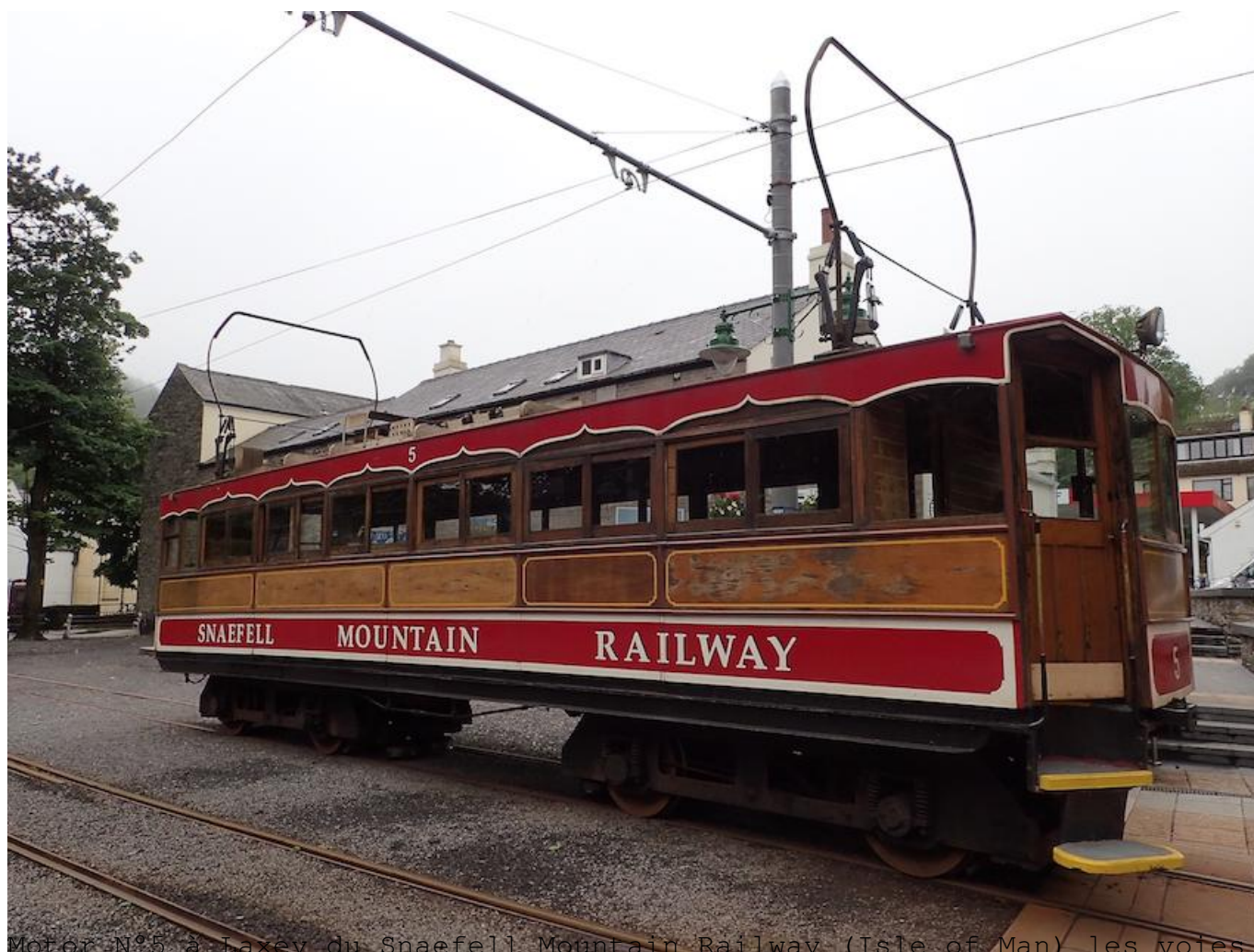
Motor N°5 à Laxey du Snaefell Mountain Railway (Isle of Man) les voies sont en 3 pieds 6 pouces = 1067 mm. (2017)