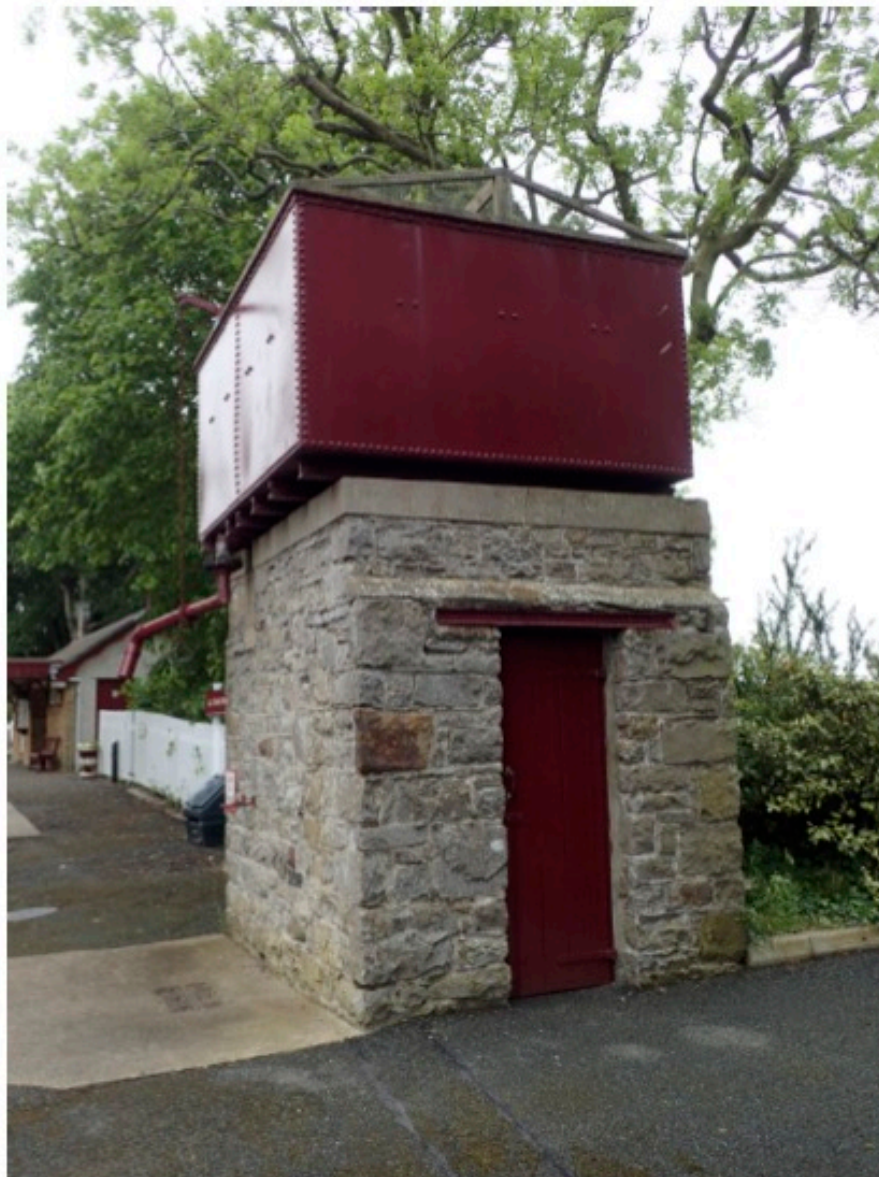
Château d'eau à la gare de Ballasalla

Comme partout, lors du développement du réseau routier, le chemin de fer a perdu de l'attrait et des lignes ont fermé à la fin des années 60, puis déferrées dans les années 70. Il reste de nombreux témoins de cette époque, comme des bâtiments de gare, maisons de garde-barrière ou d'œuvres d'art (ponts, emprises de voies de ferrées).