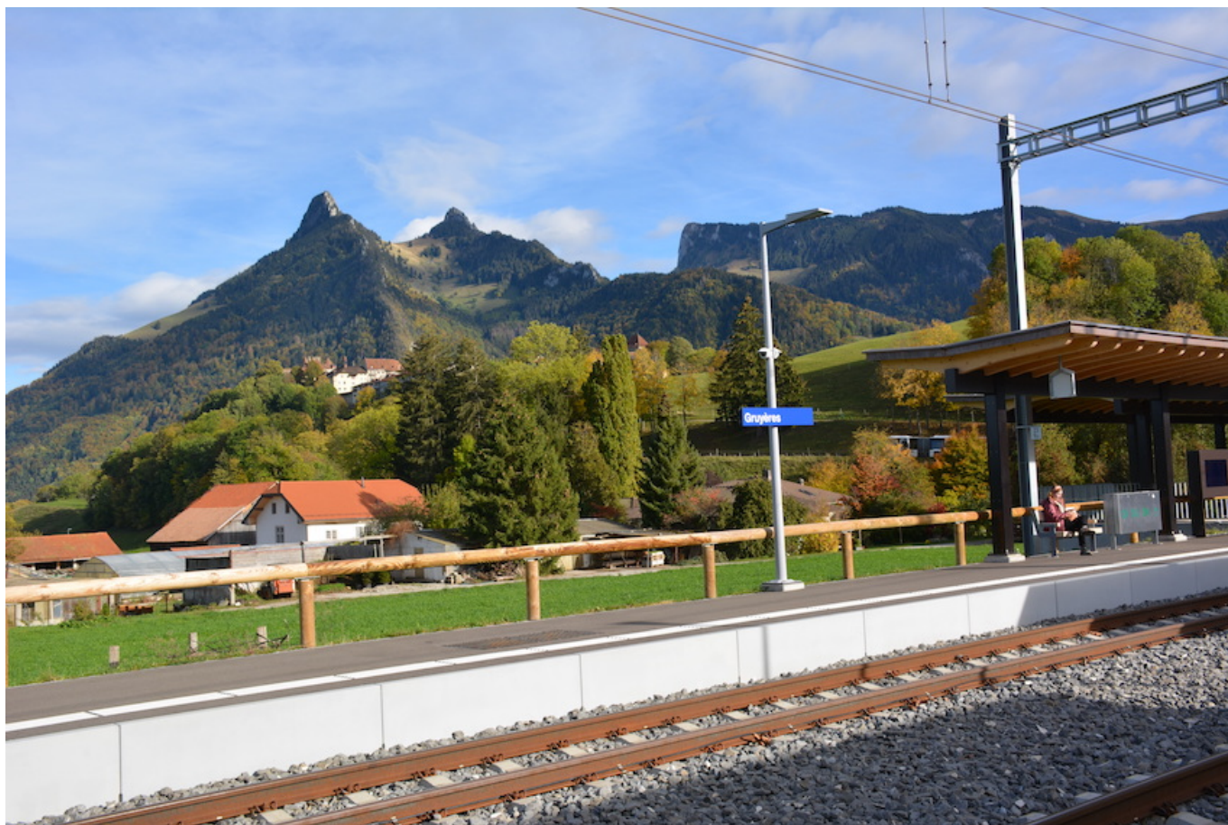
LA GRUYÈRE dans son pays.